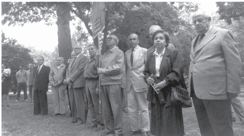
Un gruppo di partigiani (1993) a Villa Braga di Mariano dove ogni anno si ricorda la sera del 9/9/1943 in cui si svolse la prima riunione di alcuni antifascisti parmigiani che dettero vita alla Resistenza.