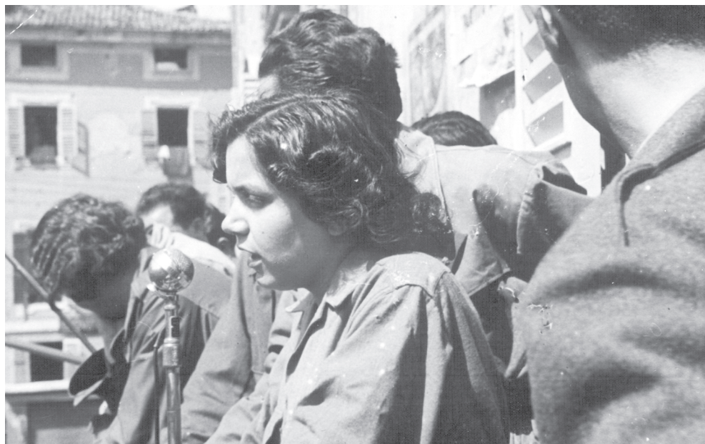
"MIRKA" sul palco in Piazza Garibaldi subito dopo la liberazione.

Per rimanere al 1946, devo dire che vi era, allora, un'organizzazione femminile molto attiva, anzi ce n'erano due: il Centro Italiano Femminile, il CIF, che