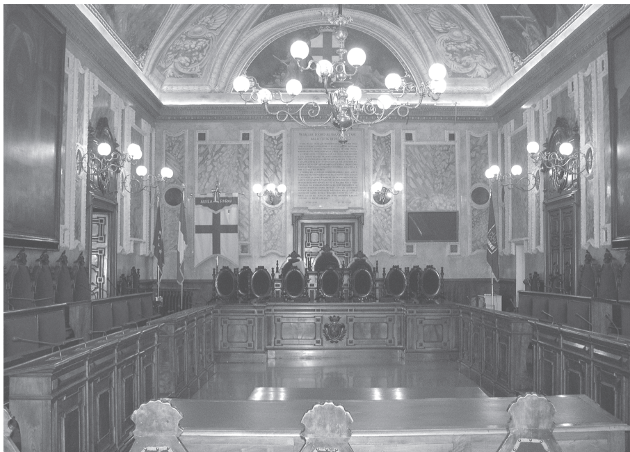
Sala del Consiglio Comunale di Parma.