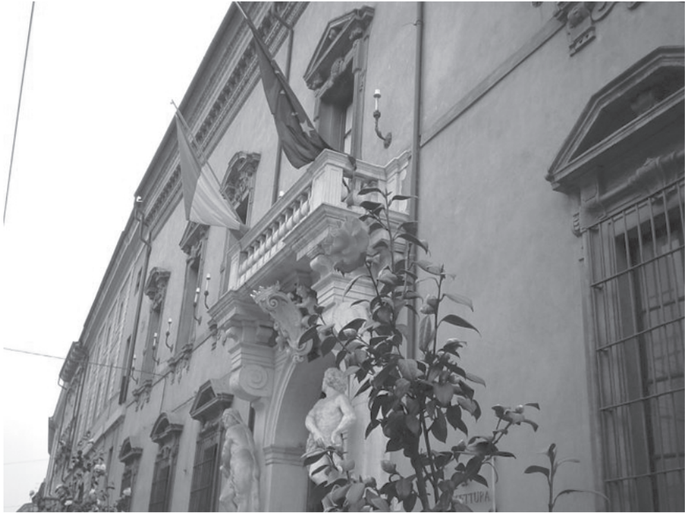
Palazzo Rangoni, sede della Prefettura di Parma.